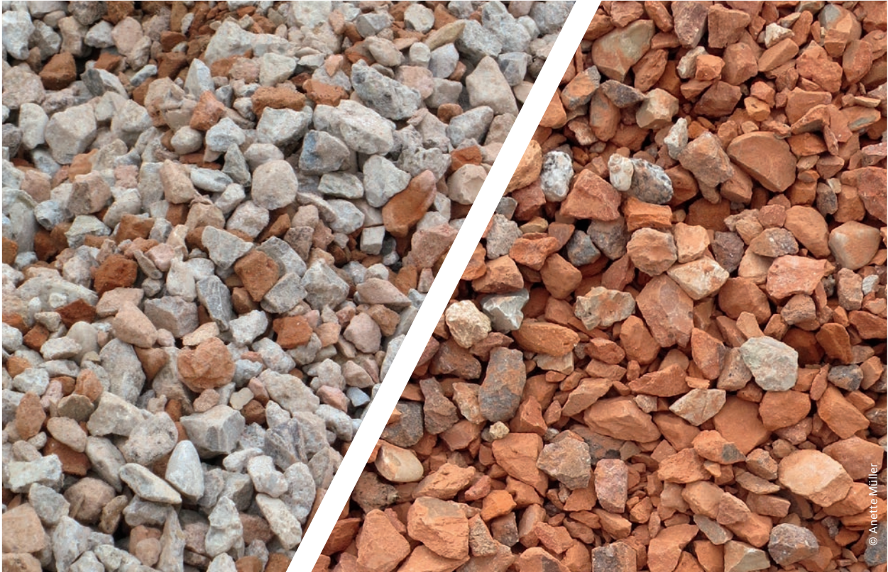
Rezyklierte Gesteinskörnungen mit unterschiedlichem Ziegelanteil. [6]