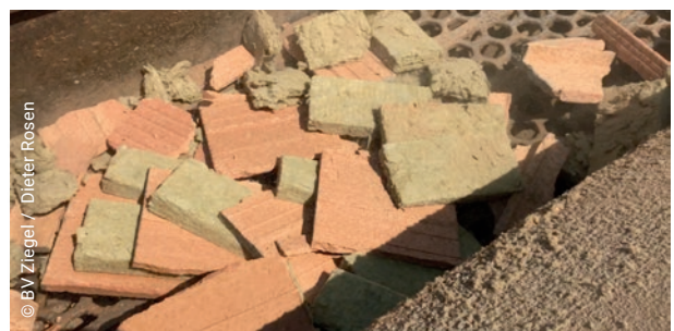
Mauerziegel mit Dämmstofffüllung aus Mineralwolle-Stecklingen. Die Füllungen sind durch Formschluss in den Kammern und Lochungen fixiert. Dadurch lassen sich im Recycling leicht Keramik und Dämmstoff trennen.

Bei der Annahme von Mischabfällen wird teilweise auf gelegentlich noch vorhandene Stecklinge oder Füllungen aus KMF verwiesen, deren Art und Herkunft nur durch In-Augenscheinnahme zu bestimmen ist. Fakt ist: Die zugrundeliegende allgemeine bauaufsichtliche Zulassung für mit Dämmstoff gefüllte Mauerziegel seit 2007 lässt den Schluss zu, dass keine Ziegelsteine mit „alten“ Mineralwollen gefüllt sind. Bei den zum Einsatz kommenden KMF handelt es sich ausschließlich um unbedenkliches Dämmmaterial, das nach dem 1.6.2000 in Verkehr gebracht wurde.