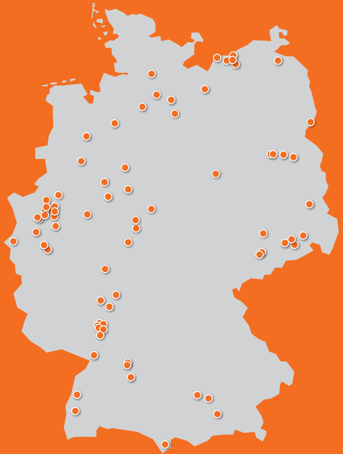
Standorte von Recyclingunternehmen mit Spezialisierung auf Annahme und Aufbereitung von Dachziegeln und ziegelreichen Bauabfällen. Stand 2020. Grafik: BV Ziegel / Julian Klinner

Zum Netzwerk gehören Abbruch- und Recyclingunternehmen sowie sogenannte Veredler. Sie verarbeiten Ziegelbruch zu Substraten für die Dachbegrünung, Schotterrasen, GaLa-Bau-Erden oder recycelten Baustoffen für Straßen und Wege sowie Gesteinskörnungen für Tennendecken. Der Bundesverband Ziegel wird mit Marktpartnern Wege und Lösungen sondieren, um den Stoffkreislauf weiter zu optimieren – im Interesse des gemeinsamen Zieles, den Klima-, Umwelt- und Naturschutz voranzubringen.