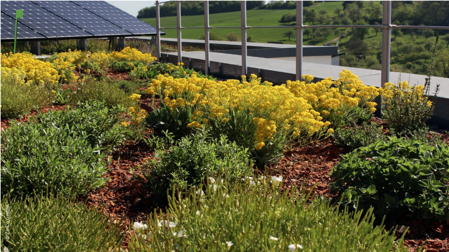
Substrate für Dachbegrünungen aus speziell aufbereiteten Tonziegeln sind geeignet für ein- oder mehrschichtige Bauweisen. [7]